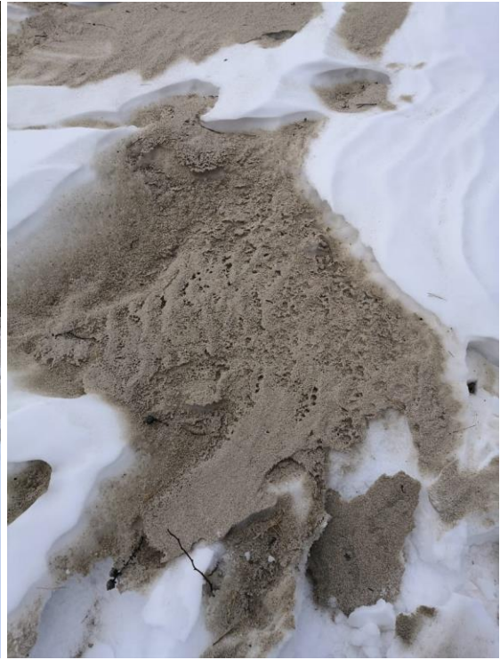
Рисунок 5, 6.